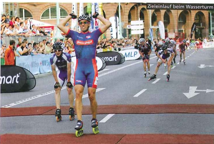
Zieleinlauf beim Wasserturm