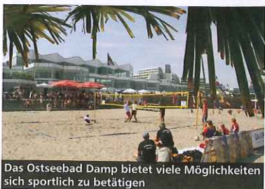
Das Ostseebad Damp bietet viele Möglichkeiten sich sportlich zu betätigen

Bereits am Vorabend, am Samstag, 12.6.2010, wird beschleunigt. Um 19 Uhr gehen beim ersten „Nordic Skate Rennen“ Sportler/innen mit größeren, sogenannten „Cross-Rollen“ an den Start. Gleichzeitig wird über die Distanz von 21,2 km ein Halbmarathonrennen für alle Inlineskater/innen gestartet. Dieses Rennen ist Teil von „Skate the North“ und gleichzeitig offizieller Wertungslauf für „NordCup und NordLiga“, der ältesten Skateserie Deutschlands.